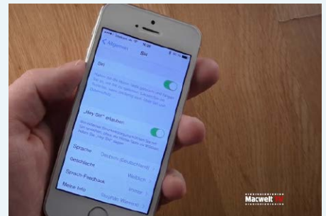
▲ „Hey Siri“ erlaubt es, Siri automatisch aufzurufen.

kömmliches graues oder ein modernes dunkles Design. Praktisch ist der Graphic Converter nicht zuletzt, da er weit mehr Bildformate als Vorschau oder Photoshop öffnen und in eines von mehreren Dutzend Formaten umwandeln kann. Zur Installation: Um ihre Version zu aktivieren, müssen Sie einen Freischalt-Code anfordern. Dazu geben Sie auf der Internetseite www.lemkesoft.de/coupon den Coupon-Code „graphicconverter“ und Ihre Daten ein. Sie erhalten die Seriennummer dann umgehend per E-Mail zugeschickt. Tipp: Eine Vollversion der aktuellen Programmversion Graphic Converter 9.3 können Sie zu einem Sonderpreis von 24 Euro erwerben. Eine Registrierung ist bis Anfang Dezember möglich, bei weiteren Fragen wenden Sie sich bitte an den Hersteller unter der E-Mail-Adresse support@lemkesoft.de . sw