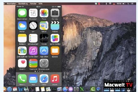
▲ Zusammen mit Yosemite können Sie den iOS-Bildschirm abfilmen.