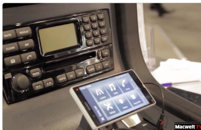
Auf dem Mobile World Congress in Barcelona gab es zahlreiche Szenarien zur besseren Integration von Smartphones in Autos zu sehen.

wurde, sorgte bereits beim Start vor einigen Wochen mächtig für Furore, weil der Hersteller die Nutzung nur per Ticketsystem ermöglichen wollte, um den Ansturm bewältigen zu können. Wir haben das E-Mail-Programm testen können und decken Pluspunkte, aber auch einige Schwachstellen auf. Auf dem ersten Blick ist das Programm sehr vielversprechend. Es