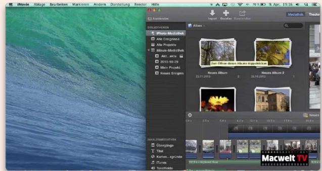
Die Nap-Funktion kann lästig sein, wenn man zwei Programme gleichzeitig bedienen möchte. Wir zeigen Ihnen, wie Sie App Nap ausschalten.

Mit Plex Home Theater verwalten Sie Fotos, Videos und Audiodateien. Man kann auch RSS-Feeds abrufen, iTunes Visualizer abspielen, iTunes DRM-Titel nutzen und DVDs ansehen. Sehr umfangreich sind die Funktionen als Video-Player. So unterstützt das Programm neben WMV und Quicktime auch MPEG2-Dateien. Ein Webserver ist integriert, über den sich das Programm ebenfalls steuern lässt. Remux ist ein einfach bedienbares Tool, mit dem man ein Video in ein anderes Format umwandeln kann – etwa um es mit iTunes kompatibel zu machen. Hat man beispielsweise ein Flash-Video heruntergeladen, das den Codec H.264 nutzt, kann man es oft ohne zeitraubende Neunkon-